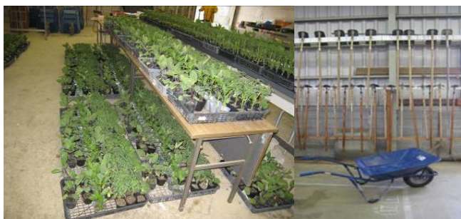
農具や主な苗などはセンターで準備