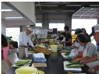
収穫した野菜を漬け物に加工