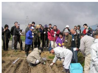
ほ場での栽培技術指導