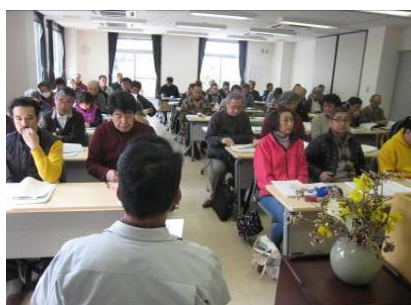
月2回の栽培技術講義

専任指導員（県職員OBなど）による指導で野菜栽培に必要な知識や技術が身につきます