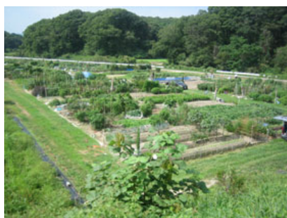
おおぞうコミュニティファーム神付ふるさと村