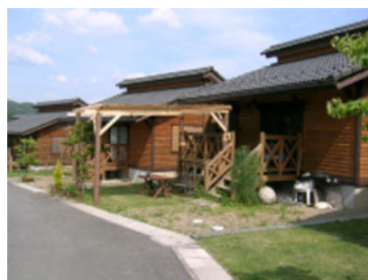
大山荘の里市民農園