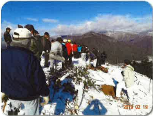
去年の植樹の様子