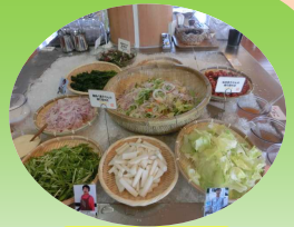
その他 50種類以上の創作野菜料理