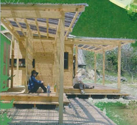
広いテラスを持つ管理事務所