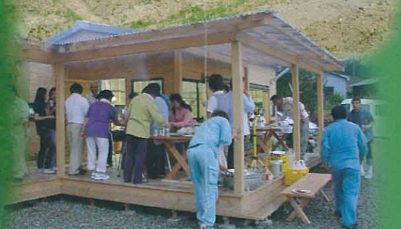
夏、開設準備のメンバー達が テラスでバーベキューを楽しむ