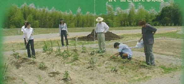
春、苗を植える家族