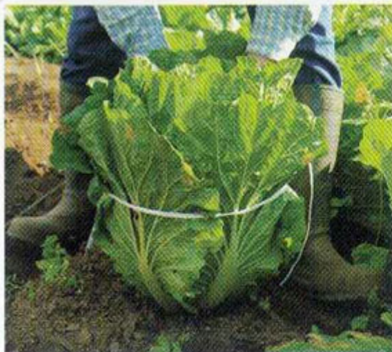
② 株の中心のあたりをひもで結びます