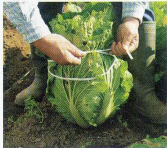
③ 株の上部をひもで結びます